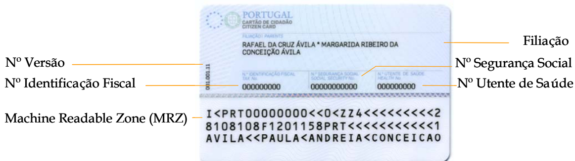
Figura 1-2 Informação inscrita no verso do cartão

O verso do cartão de cidadão contém informação textual específica dos actuais documentos de identificação sectoriais (Finanças, Segurança Social e Saúde) do titular, bem como uma zona de leitura óptica – Machine Readable Zone (MRZ).