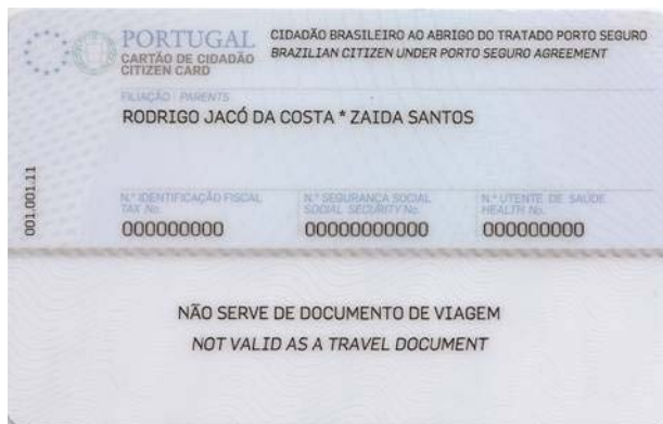
Figura 4-2 Verso do cartão de cidadão

Na zona de leitura óptica consta a menção de que o cartão de cidadão não serve como documento de viagem. Esta especificação decorre do disposto na Lei n.º 7/2007, de 5 de Fevereiro e no Decreto-Lei n.º 154/2003, de 15 de Julho.