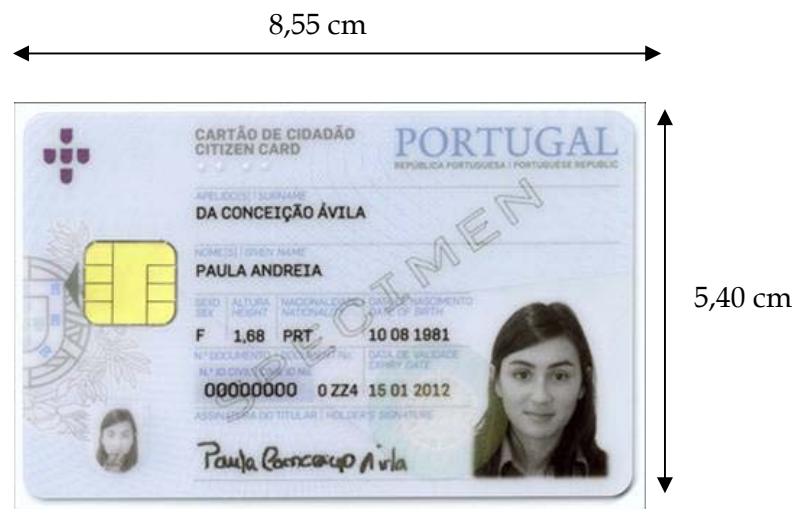
Figura 3-1 Frente do cartão de cidadão