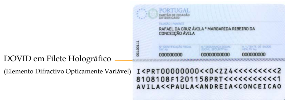
Figura 6-2 Características de segurança simples no verso do cartão de cidadão