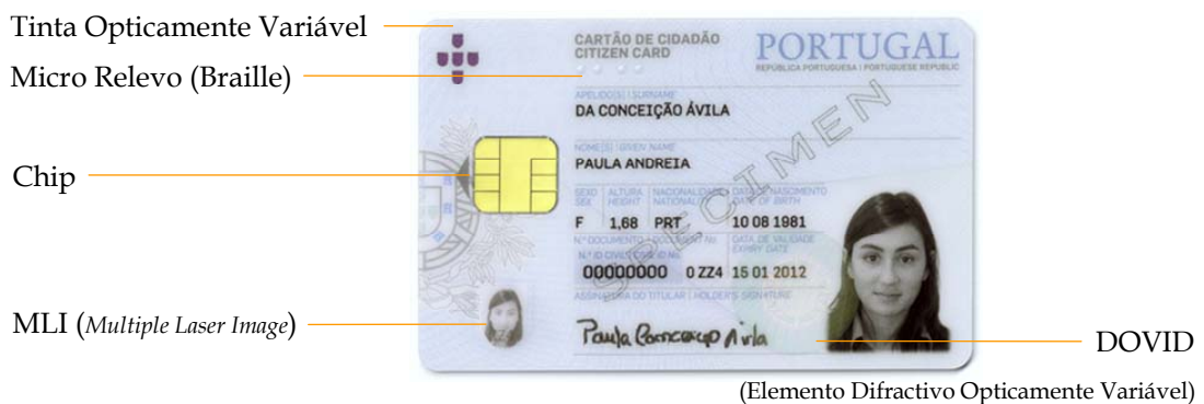
Figura 6-1 Características de segurança simples na frente do cartão de cidadão