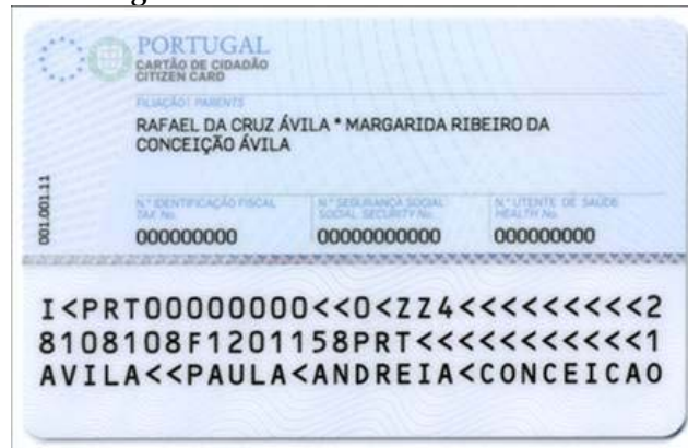
Figura 3-2 Verso do cartão de cidadão