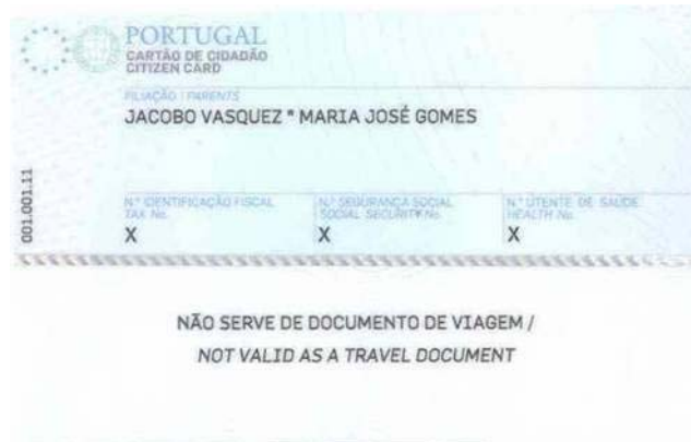
Figura 5-2 Verso do cartão de cidadão

Nesta situação o cartão de cidadão apresenta a validade de apenas de 1 ano, tendo em conta o disposto no artigo 61.º da Lei n.º 7/2007, de 5 de Fevereiro.