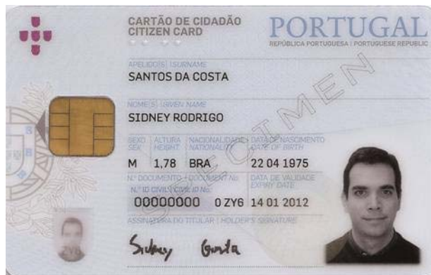
Figura 4-1 Frente do cartão de cidadão